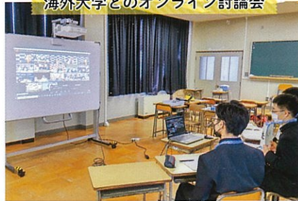
海外大学とのオンライン討論会