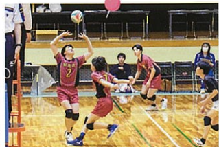
男子バレーボール部