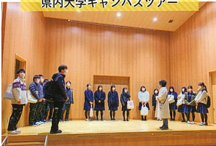
県内大学キャンパスツアー