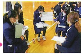
トークフォークダンス 地域の方へプレゼン、 地域の方と対話